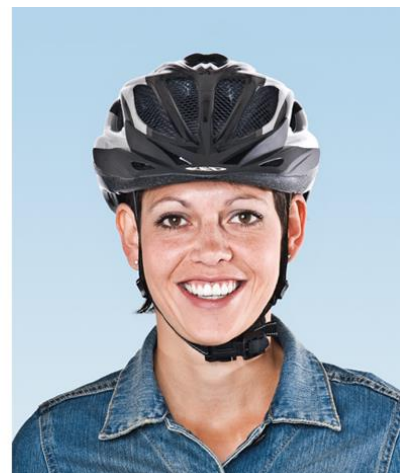
3. Sitzt perfekt! Gute Fahrt