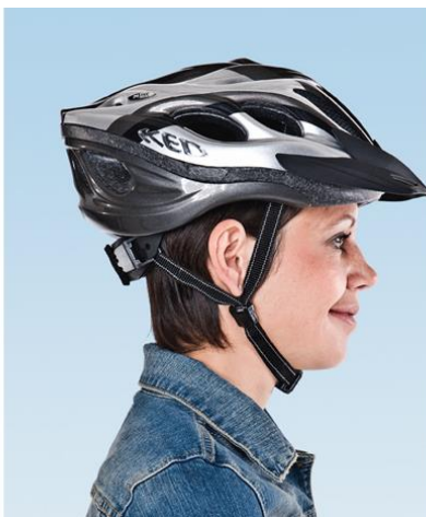
2. Seitenbänder gleich satt, zwischen Kinn und Band Platz für einen Finger