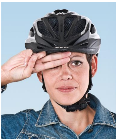
1. Zwei Finger breit über der Nasenwurzel

Wichtig: Nur ein korrekt sitzender Helm schützt.