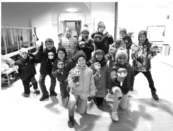
Impressionen vom Räbeliechtli- und Laternenumzug