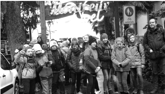
Die 6. Klasse in Montreux unterwegs