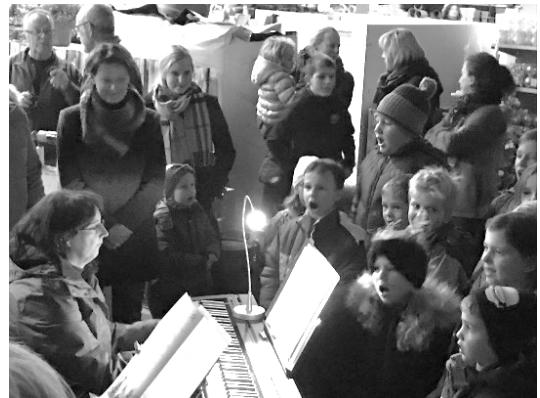
Adventssingen bei Huplant