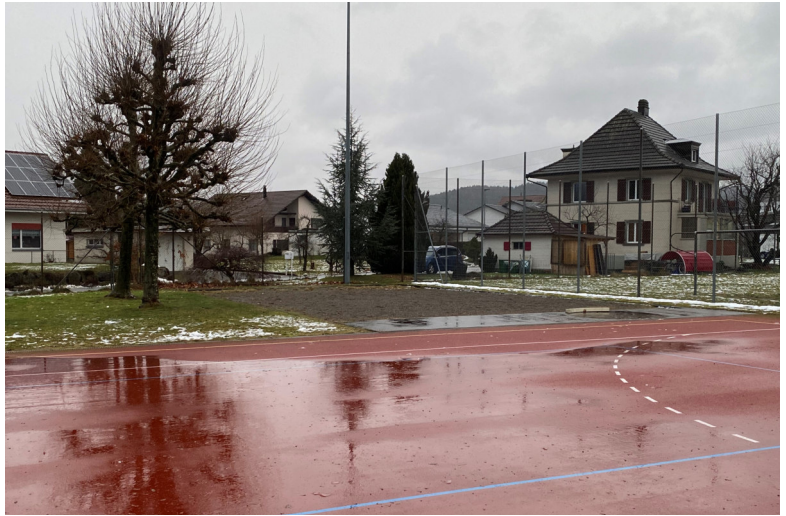
künftiger Standort der 3. Kindergarten-Abteilung