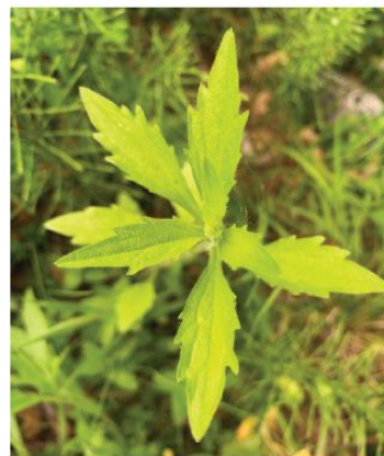
Hellgrüne behaarte Blätter, am Rand grob gezähnt