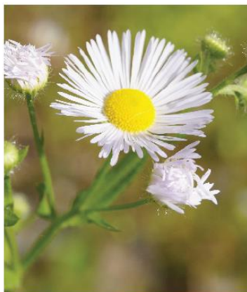
Blütenkörbchen 1–2 cm breit, viele schmale Zungenblüten in weiss bis lila

Das einjährige Berufkraut ist ein invasiver Neophyt, der sich stark ausbreitet. Aus Einzelpflanzen entstehen schnell dichte Bestände. Andere Arten werden verdrängt und die Biodiversität nimmt ab. Das einjährige Berufkraut lässt sich nur gemeinsam bekämpfen. Einzelpflanzen in einer sonst freien Fläche sollten sofort ausgerissen werden. Weitere Informationen inkl. Bildmaterial finden Sie auf unserer Homepage bei den Neuigkeiten.