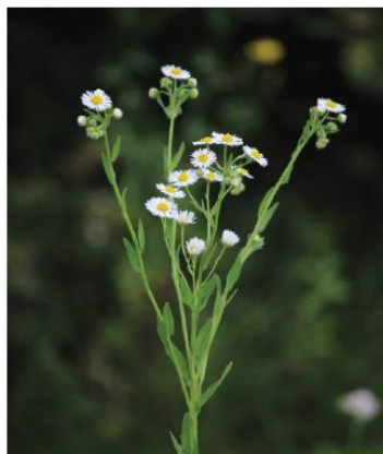
Behaarte Stängel, oben verzweigt, bis 1,5 m hoch