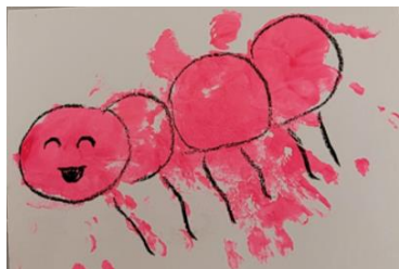
Bastelspass am Chäferli-Träff

Herzliche Sommergrüsse vom ganzen Vorstandsteam!